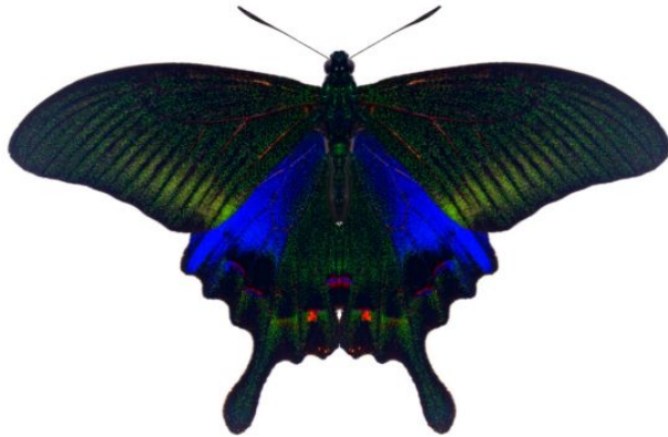
属 Papilio 種小名 bianor 英名 ChinesePeacock 和名 カラスアゲハ 分布 東アジア 開長 90mm 食草 キハダ(北海道)、コクサギ、ハマセンダン 代表種-コクサギ