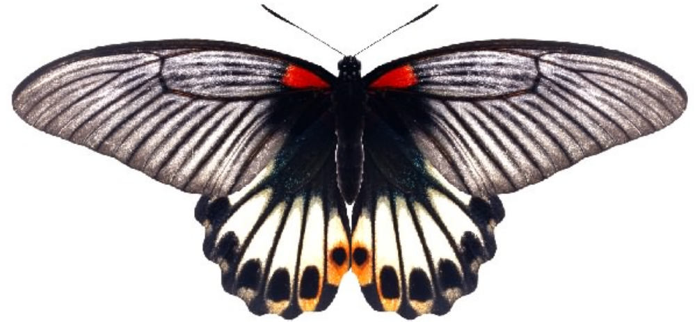
属 Papilio 種小名 memnon 英名 和名 ナガサキアゲハ 分布 東アジア日本以南 開長 136mm ♀ 食草 栽培ミカン