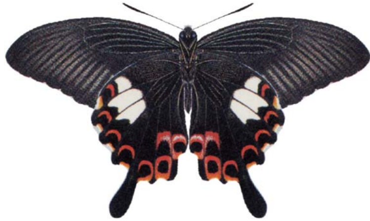
属 Papilio 種小名 helenus 英名 RedHelen 和名 モンキアゲハ 分布 日本～東南アジア 開長 116mm UN 食草 カラスザンショウ